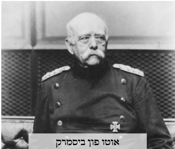
אוטו פון ביסמרק

לפרנס אותם, אם הם גרים בארץ משלהם אומרים שהם השתלטו על קרקע, ואם הם בגולה אומרים שהיהודים באו להשתלט, ולמה אתם נושמים לנו את האויר וכו' שורש הכל היא השנאה אך הגוי צריך להסביר לעצמו למה הוא שונא, ואז מתחילות התאוריות הגזעניות, הסברים מדעים למה צריך לשנוא יהודים, ומדוע חייב להפלות את היהודי לרעה בלי קשר למעשיו, לאמונתו, ולמעמדו החברתי, ולכן נפתחת מכללה ללימוד תורת הגזע, היא מתפתחת בגרמניה וצוברת קהל מעריצים ולומדים, וכך נכתב ע"י כמה סופרים מהמכללה האנטישמית 'הקו המשותף הוא שהיהודים שנואים לא בגלל מעשיהם אלא בגלל הגזע שלהם, והנצרות היא הדת של הגזע הארי, והיא חייבת לנתק את עצמה מיהדות התנ"ך, אנחנו הגזע הארי, היהודים הם הגזע השאמי - הגזע הנחות'. והקו המנחה של המכללה הוא ערך והעליונות הגזע הארי ונחיתות הגזעים האחרים, ומכך את חשיבות חיסול הגזעים הנחותים בעולם